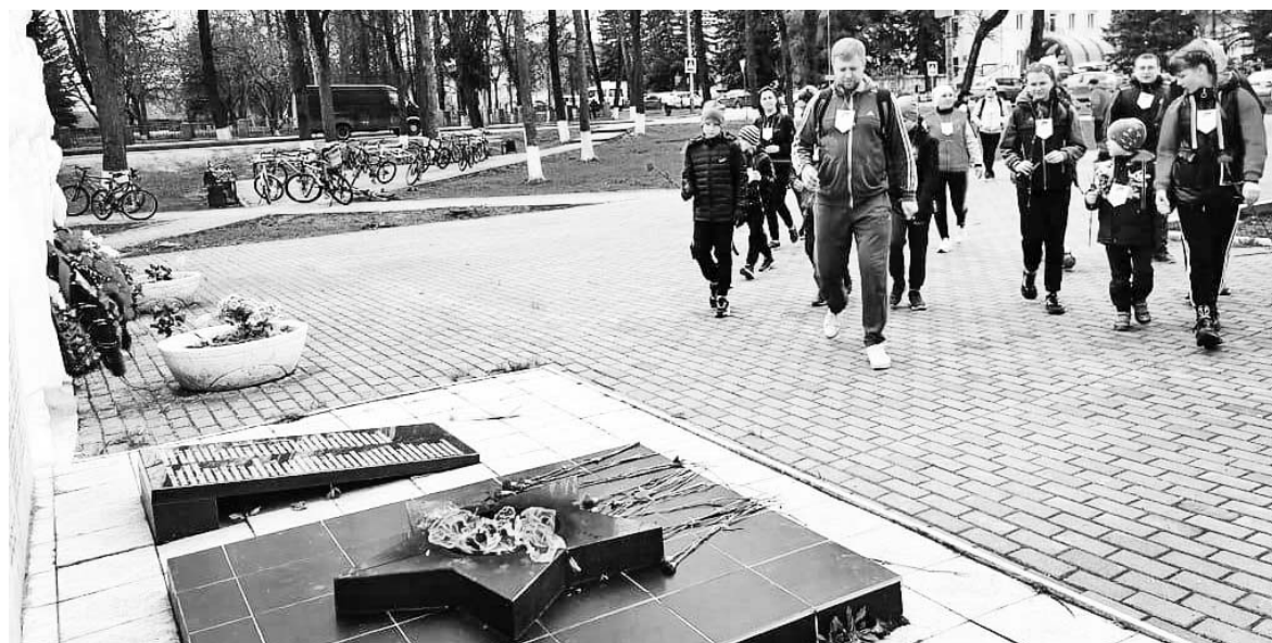
1 мая думиничане совершили традиционный велопробег по маршруту Думиничи-Хотьково, посвященный годовщине Великой Победы. Фоторепортаж - в ближайшем выпуске «ДВ».