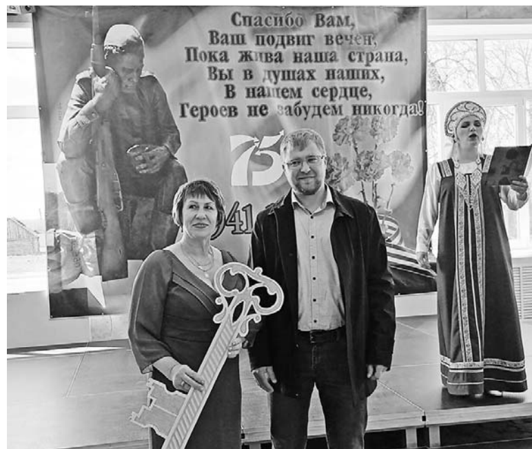
В Новослободске торжественно открыли обновленный после капремонта сельский Дом культуры. Рассказ о событии - в следующем выпуске «ДВ».